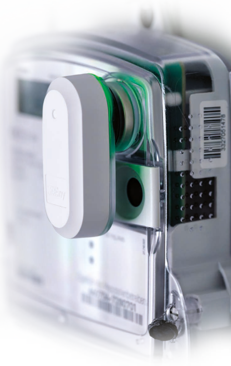
XEEny auf Stromzähler

Für die Funkkommunikation von den Messstellen an das Gateway ist wireless M-Bus (wM-Bus)/OMS der klar dominierende Standard. Die Funktechnologie wM-Bus/OMS ist europaweit standardisiert, herstellerübergreifend interoperabel und optimal für die Vernetzung innerhalb von Gebäuden ausgelegt.